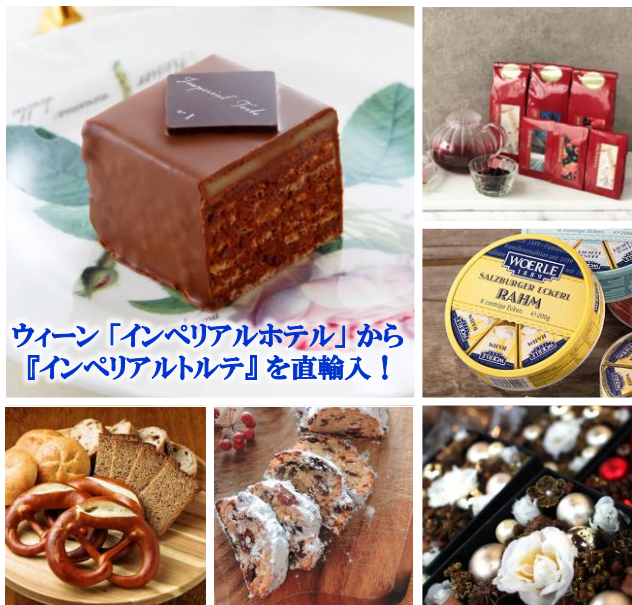
ウィーン「インペリアルホテル」から『インペリアルトルテ』を直輸入！

厳選したオーストリア直輸入の食品・ワインに加えて、クリスマスオーナメントをはじめとする雑貨類も豊富に取り揃えております。 ウィーン「インペリアルホテル」から 銘菓『インペリアルトルテ』、「Julius Meinl」（ユリウス マインル）のオリジナルコーヒー、「Haas & Haas」（ハース&ハース）の紅茶等、またザルツブルクRasp社よりスパイスオーナメントを直輸入。 ウィーンのクリスマスマーケットの雰囲気是非お楽しみください。 ※輸入商品のため、数に限りがございます、また内容が変更になる場合もございます。ご了承ください。